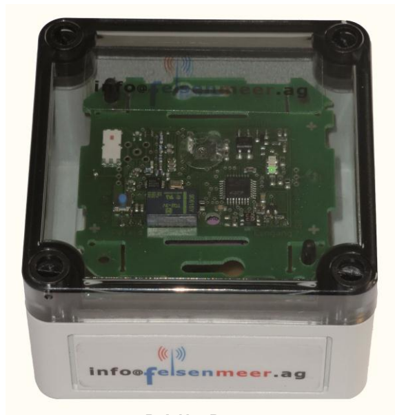
D.A.N. - Detector (Detection and Alarming Network)

Absicherung von Service- u. Wartungspersonal im In-House Einsatz