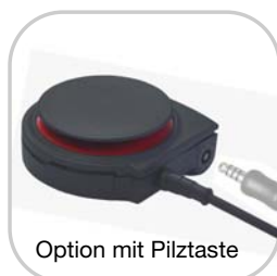
Option mit Pilztaste